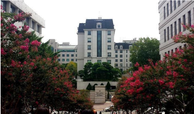
Sicht auf Campus II