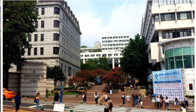
Sicht auf Campus I